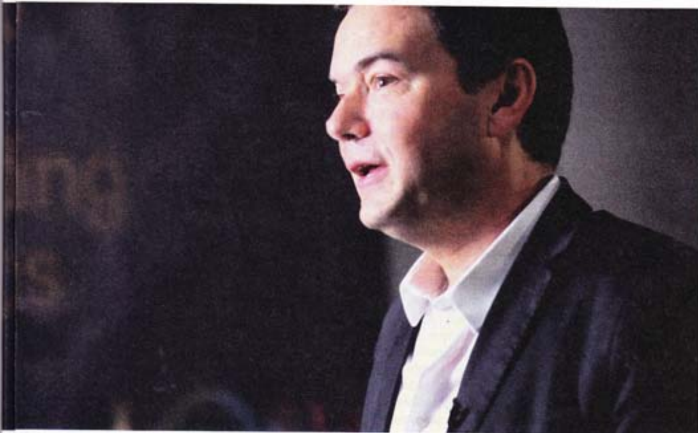
AUTOR I DELO: Toma Piketi i izdanje knjige na srpskom