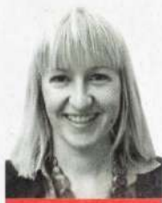
Пише НАТАША АНЂЕЛКОВИЋ

Иако се Дивојнице могу читати као узбудљив роман са могућом сликом живота у античком Београду и фаталним љубавним заносима од којих се губи разум и преокреће судбина, то остаје у својој суштини роман о моћи женске лепоте, сензуалности и љубави да одржава и обнавља живот